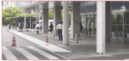
③ 奥にあるバス停の前の「タクシー」が停まっている道を右へ