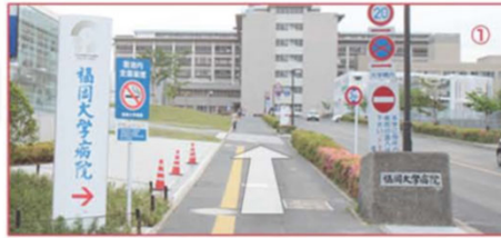
① 福岡大学病院の正門から、矢印方向へまっすぐ直進

九州自動車道、大宰府ICより福岡都市高速道路を經由し、野多目・堤方面へ左折後、堤ランプで降車。そのまま国道202号線（福岡外環状線道路）に入り2kmほど直進後、福大トンネル手前を右折し福岡大学病院方面に向かい福大病院東口交差点を右折してください。