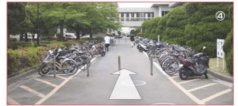
④ 曲がってから矢印方向へと直進