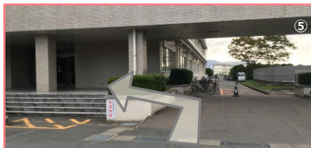
⑤ 2階連絡通路の下をくぐらずに、左手の建物入り口へ