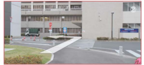
② まっすぐ進み突き当たったら、矢印の方向へ進む